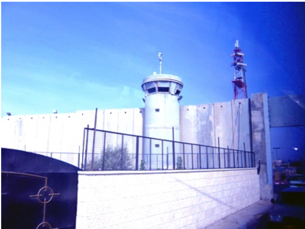
Udsnit af MUREN ved Bethlehem.