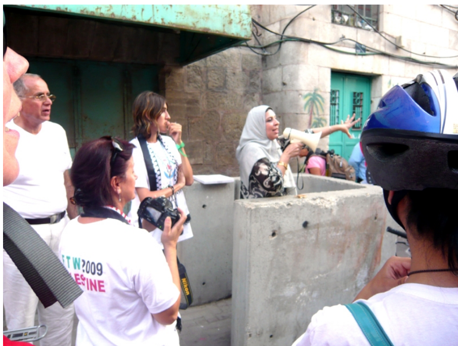
Deltagerne orienteres om besættelsen af Hebron.

Vi kører væk i vore store flotte turistbusser. Vore cykler venter og vi skal cykle ind i Hebron. Den meget omtalte by, hvor bosætterne tager flere og flere lejligheder. Rigtig mange mennesker i gaderne. Lidt anspændt stemning. Men pigerne smiler og deler mange af vore små blade ud, der fortæller om formålet med vores tur. Vi nærmer os centrum og håber at få adgang til den gamle bydel. Vi står der med alle vore cykler og ser på det kontrolsted der er bygget tværs over gaden. Man fortæller om de ca 2000 israelske soldater, der passer på de mindst 400 bosættere, som siden 1979 har besat Hebron centrum. Vi får ikke lov at gå ind i den gamle by med Ibrahim-moskeen, hvor Abraham og Sara skulle ligge begravet. Derfor et helligt sted for flere religioner. Højt over kontrolstedet kommer 4 israelske soldater til syne med deres maskingeværer.