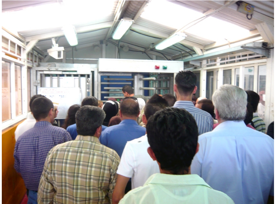
Kalandia Checkpoint er slusen, den snævre adgang til Jerusalem

Vi går fra hotel Manna ad villaveje mod busstationen. Den sidste del af gåturen i meget tæt bytrafik i Ramallah. Der er virkelig mange mennesker i gaderne. Lokalbussen kører os til Kalandia, turens største forhindring. Et kontrolsted af beton og stål, en folkeretslig passage mellem 2 af Israels besatte områder. Det tager ca en time at komme igennem en af 5 løbeganke, så solide at et næsehorn ikke kommer igennem. Det er tilfældigt hvilken bås, der åbnes. Snart den ene - snart den anden. Man venter og venter. Hvor må det være svært for folk, der skal på arbejde hver eneste dag at blive udsat for denne kontrol.